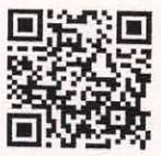
QR-Code เพื่อจองห้องพัก

โทรศัพท์: ๐๒-๔๒๒-๙๒๒๒ E-mail : rsvn@royalriverhotel.com